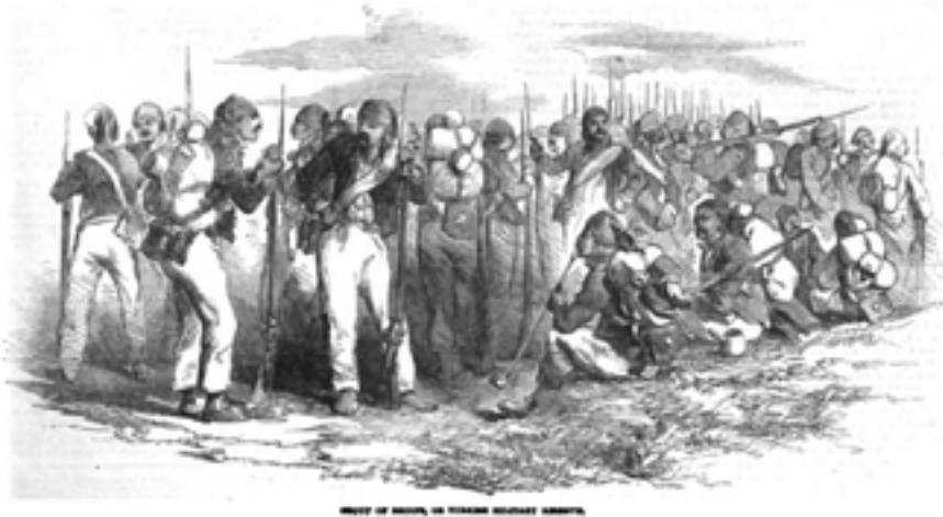
Resim 5: Savaş Öncesinde Osmanlı Ordusuna Ait Bir Grup Yedek Asker (Redif)

piyade ve 25.000 süvariden (atlı asker) oluşurken, Osmanlı ordusunda 75.000 piyade 8.000 de süvari mevcuttu (Illustrated London News, 17 September (Eylül) 1853: 223). Hazırlıklar ve Kuzey Afrika'dan gelen destekler sayesinde piyade sayısında kısmi bir denge sağlanmış olsa da, süvari sayısı üzerinden bir kıyaslama yapıldığında, asimetrik fark kapatılmamıştı.