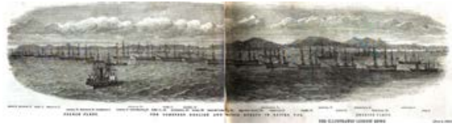
Resim 3: Beşik'da konuşlanan İngiliz filosu, Kaynak, Illustrated London News

noktasında donanmasını güçlendirmeye zorladı. Fakat, Karadeniz'deki donanma dengesini İmparatorluk lehine değiştirme sorununu iç kapasite ile (yeni gemi inşası ve eyaletlerden donanma desteği isteme) çözmeye imkan yoktu. Dolayısıyla Osmanlı devlet adamları için Karadeniz'deki Rusya lehine olan donanma dengesini değiştirmenin tek yolu Fransız ve İngiliz donanmalarının olası bir savaşta İmparatorluğun yanında yer alacaklarını garanti etmekte. 1853 yazında Fransız ve İngilizlerin Akdeniz donanmaları Beşik Körfezi'ne gelmiş olsalar da, bu Karadeniz için çok fazla bir şey ifade etmiyordu. Yine Ekim ayında Beşik'dan ikişer geminin İstanbul'a yollanması da Karadeniz'deki donanma dengesini değiştirmek için yeterli değildi.