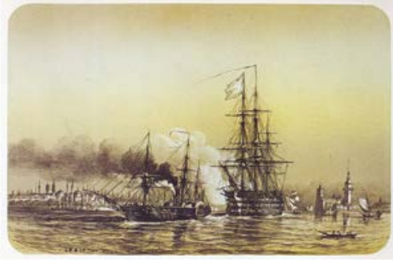
Resim 4: Ağustos 1853'te Fransızların 120 silahlık savaş gemisi Friedland, Osmanlı-Rusya krizinin tırmandığı dönemde uğradığı kaza sonucu tamir edilmek için İstanbul'a geldi. Bu durum 1841 sözleşmesinin (barış zamanında savaş gemileri boğazlardan geçemez) ihlali olsa da, tamir gerekçesi İstanbul'a gelmesi için işe yaradı.

İngiltere'nin desteği konusundaki netlik Raşid'in savaş kararının alındığı 25-26 Eylül'de toplanan Meclis-i Vala'daki konuşmalarına yansdı. Kendisine "büyük güçler bizimle olacak mı?" şeklindeki soruya (Badem, 2010: 96) önceki toplantılardan farklı olarak daha olumlu bir yanıt verdi. Meclis 26 Eylül'de savaş kararı olsa da, karar Padişah'ın onayı ve Şeyhülislam'ın fetvasının ardından ancak 4 Ekim'de resmileşti. Aynı gün Clarendon'un emri İstanbul'a ulaşmış (Temperley, 1936: 354) olsa da, Osmanlı devlet adamları bir süredir İngiltere'nin Beşik'a'daki donanmayı İstanbul'a göndereceğine kesin gözüyle bakıyordu. Zaman İngiltere'nin Beşik'a'daki donanmayı İstanbul'a gönderme niyetini Osmanlı devlet adamları açısından daha net hale getirmişti. Fakat yine de, destek somut hale dönüşene kadar Osmanlı savaşı başlatacak adımı atmamak yerine karşı tarafa Tuna eyaletlerinden çekilmek için 15 günlük süre tanımayı tercih etti. Bu ultimatoma Rusya'ya verildiği gün Reşid Paşa hem İngiliz hem de Fransız elçilerden Beşik'a'daki donanmaların İstanbul'a getirilmesini resmi olarak talep etti. 20 Ekim'de Stratford, Beşik'a'daki İngiliz donanmasını İstanbul'a çağırdı. Karadeniz'deki donanma dengesi artık önemli ölçüde sağlanmış, üstelik de iki büyük gücün Osmanlı yanında yer alacağı netleşmişti. 22 Ekim'de Osmanlı ordusu Tuna'yı geçerek Rus hedeflerine saldırınca savaş filli olarak başladı.