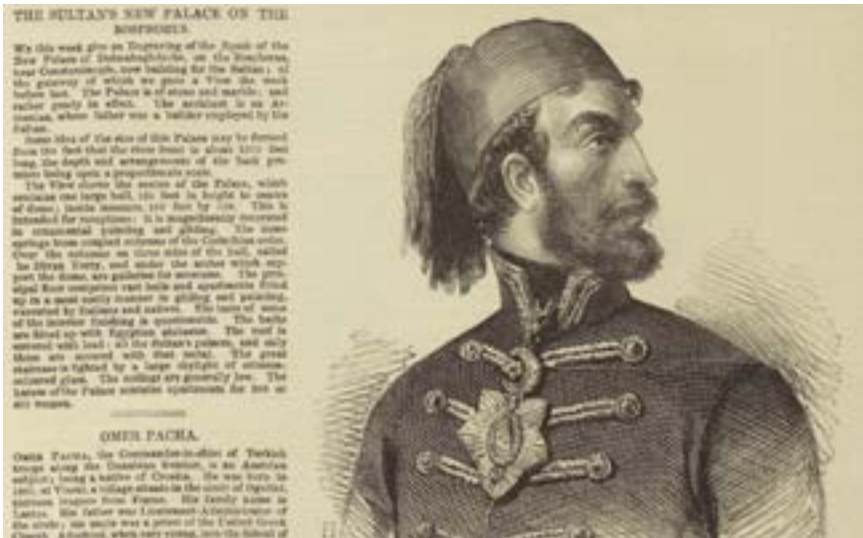
Resim 6: Tuna Ordusunun Komutanı Ömer Paşa

Kafkas cephesinde Osmanlı'nın Ruslara karşı önemli avantajı Rusya kontrolündeki Kafkas topraklarında bulunan Müslüman nüfustu. Bu nüfus uzun bir süredir Rusya egemenliğine dirense de Osmanlı'dan maddi yardım alması mümkün olmamıştı. Rusya ile savaş güçlü bir ihtimal olarak ortaya çıkınca Osmanlı devlet adamları dikkatlerini buradaki Müslüman nüfusa yöneltti. Savaş ihtimalinin ortaya çıkması ile bölgenin önemli liderlerinden Şeyh Şamil harekete geçmiş ve ordusu ile Osmanlı sınırlarına doğru ilerlemeye başlamıştı. Dağıstan bölgesinden Tiflis'e kadar gelen Şeyh Şamil aynı zamanda olası savaş için kendi bölgesinden asker toplama işini de paralel bir şekilde sürdürdü. Bu çabasının sonunda Şeyh Şamil Eylül ayının başında 10.000 civarında asker toplamıştı (Gammer, 1994: 268). Sonunda Sultan Abdülmecid 9 Ekim 1853'te uzun süredir Ruslara karşı direniş gösteren Şeyh Şamil'e bir mektup göndererek Rusya'ya karşı cihada katılmasını talep etti (Karpat, 2001: 38). Dolayısıyla, çoğunluğu Müslüman olmayan nüfusa sahip Tuna vilayetlerinden farklı olarak Kafkas cephesinde Osmanlı kendisini daha avantajlı görüyordu. Bu durum savaş kararı öncesindeki olası askeri manevralara ilişkin tartışmalara da yansdı. Osmanlı devlet adamları Tuna cephesinde bir savunma taktiği üzerinde düşünürken, Kars cephesinde hem Ruslara denk asker sayısını hem de Kafkas bölgesindeki Müslüman nüfusu göz önüne alarak saldırı temelli bir taktik tercih ettiler.