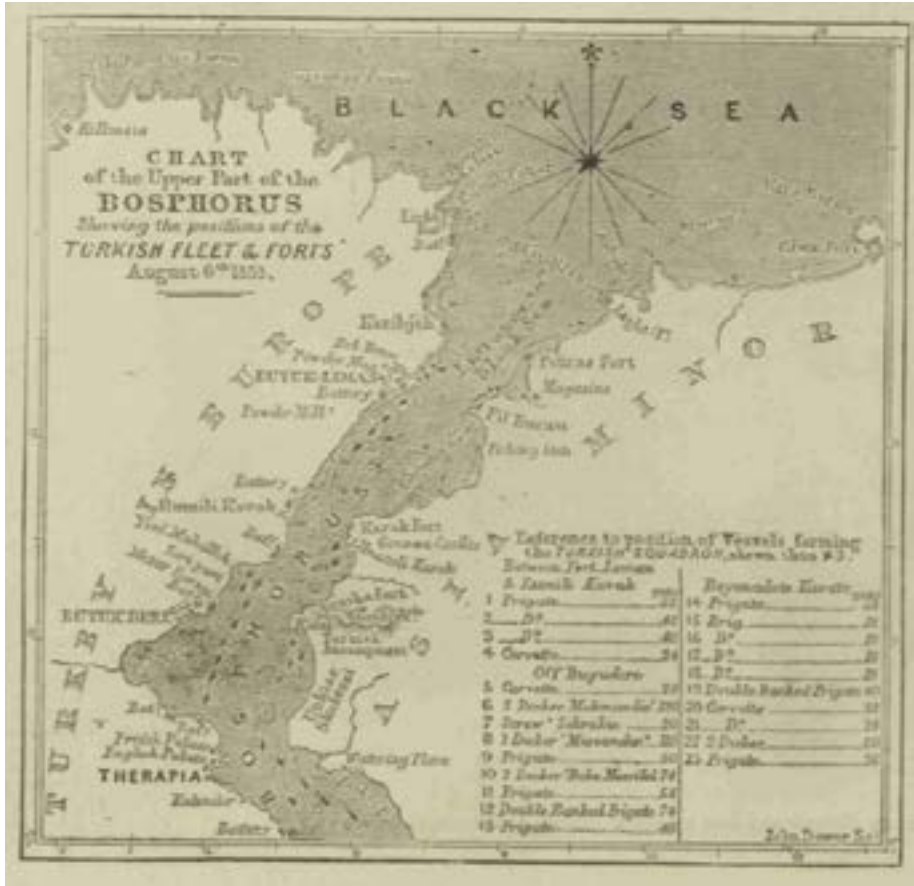
Resim 2: Osmanlı donanmasının İstanbul'un savunması için boğazın Karadeniz girişine konuşlanan gemilerini gösteren bir harita

firkateyn henüz hazır olmadığı gibi (Illustrated London News, 18 Haziran) 1853: 486) Rusya'nın üstün Karadeniz donanması karşısında bu donanma yeterli bir güvenlik sağlamıyordu. Üstelik Menşikov'un İstanbul misyonunun başarısız olması ve Osmanlı'yı Menşikov taleplerini kabul etmeye zorlamak isteyen Çar'ın Haziran ayı sonunda Osmanlı egemenliğindeki Tuna eyaletlerini işgal emrini vermesi İstanbul savunmasını daha acil hale getirdi. 10 Haziran tarihinde Boğaz'ın Karadeniz yakınlarında Rus donanmasının görüldüğü haberinin başkente ulaşması ise tedirginliği daha da artırdı.